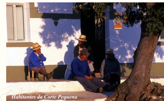
Habitantes da Corte Pequena