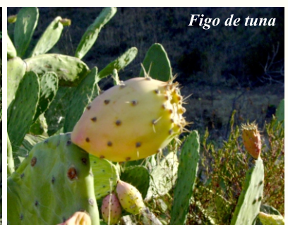
Figo de tuna